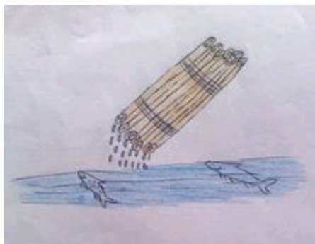
Figura 1: Questionário/Evocação Livre: termo indutor reação, Informante 5.

No comentário de seus desenhos, percebemos que utilizavam também os termos da ciência, sem deixar de explicitar o contexto em que tais fenômenos ocorriam, conforme se pode observar nas falas transcritas a seguir: