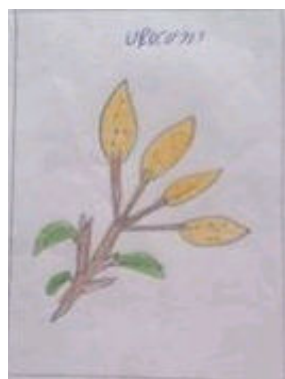
Figura 1: Questionário/Evocação Livre: termo indutor reação, Informante 6.